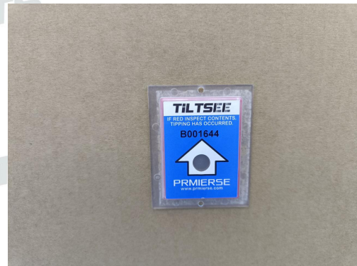
目视检查样品外观无明显异常